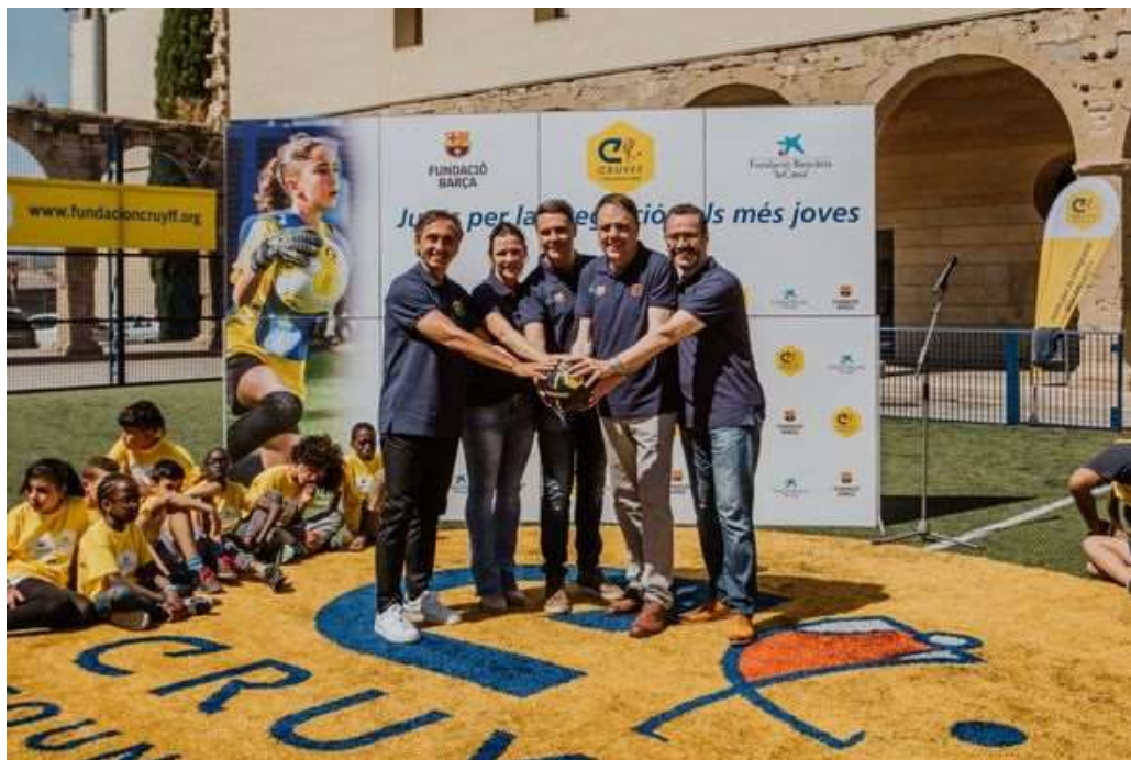
Inauguració del 'Cruyff Court Pep Guardiola' a Hostalets de Pierola en col·laboració amb "la Caixa" i la Fundació Barça (Juny 2019)